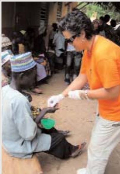
Imagen del Grupo Humanitario del Vinalopó que recibió esta distinción el año pasado

Un año más la Junta de Gobierno del Colegio de Enfermería de Alicante va a dedicar un apartado a destacar y reconocer la labor humanitaria que desempeñan los profesionales de Enfermería en el ejercicio de su trabajo. Con ello se pretende que esta labor altruista y silenciosa que en muchas ocasiones pasa desapercibida se haga visible y sea conocida tanto en el ámbito profesional como por el conjunto de la sociedad.