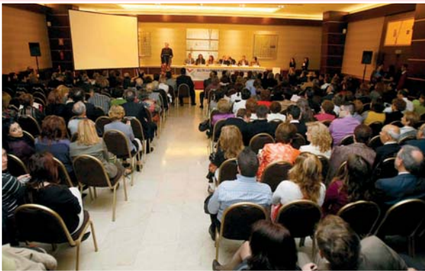
La celebración del Día de la Enfermería de la Comunidad Valenciana es uno de los actos institucionales más destacados en la agenda colegial

El 4 de diciembre tendrá lugar la celebración del Día de la Enfermería de la Comunidad Valenciana por parte del Colegio de Enfermería de Alicante. El lema elegido por el Consejo de Enfermería de la Comunidad Valenciana (CECOVA), promotor de esta celebración, ha sido el de Las enfermeras especialistas: necesidad profesional y social . Los actos se desarrollarán en los Salones Juan XXIII de Alicante y lo harán atendiendo a un programa que incluye los apartados de Justificación del lema, Entrega del VII Premio CECOVA de Investigación en Enfermería, XIX Premio Periodístico "Colegio de Enfermería", Reconocimiento a la Labor Humanitaria, Premio a la Mejor Labor Profesional de Enfermería, Reconocimiento y Homenaje a los compañeros que cumplieron 25 años de colegiación durante el año 2008, Nombramiento Miembro de Honor del Colegio y Nombramiento Colegiado de Honor 2009. Junto a ello se entregarán los premios de los certámenes de pintura y poesía.