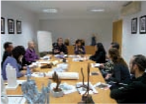
Imagen de una de las reuniones del Grupo

El Grupo de Cooperación al Desarrollo del Colegio de Enfermería de Alicante ha hecho público su desacuerdo con la situación de ajuste presupuestario por parte de los gobiernos en la que se reducen las ayudas oficiales para el desarrollo (AOD), lo que va a generar más pobreza precisamente en el año en el que la ONU ha pedido un esfuerzo a los países ricos para evitar que el número de personas que pasan hambre en el mundo, ya más de mil millo-