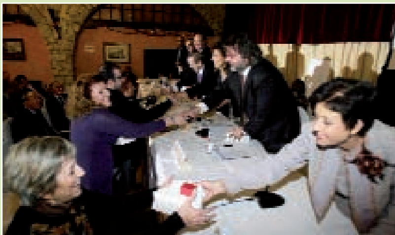
Imagen de la entrega de diplomas de la edición del Día de la Enfermería de la Comunidad Valenciana de 2009

Durante el Día de la Enfermería de la Comunidad Valenciana se rendirá homenaje a más de cien compañeros que cumplieron sus 25 años de colegiación durante el año 2009.