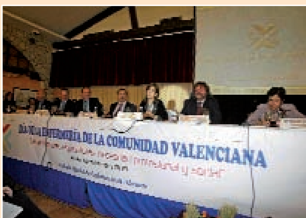
Imagen de la celebración del año pasado

Un año más, los profesionales de Enfermería de la Comunidad Valenciana se disponen a celebrar la festividad autonómica de la profesión, el Día de la Enfermería de la Comunidad Valenciana, fecha instaurada por el Consejo de Enfermería de la Comunidad Valenciana a la que los colegios provinciales se suman con la organización de diferentes actos para dar el realce y protagonismo que merece la misma.