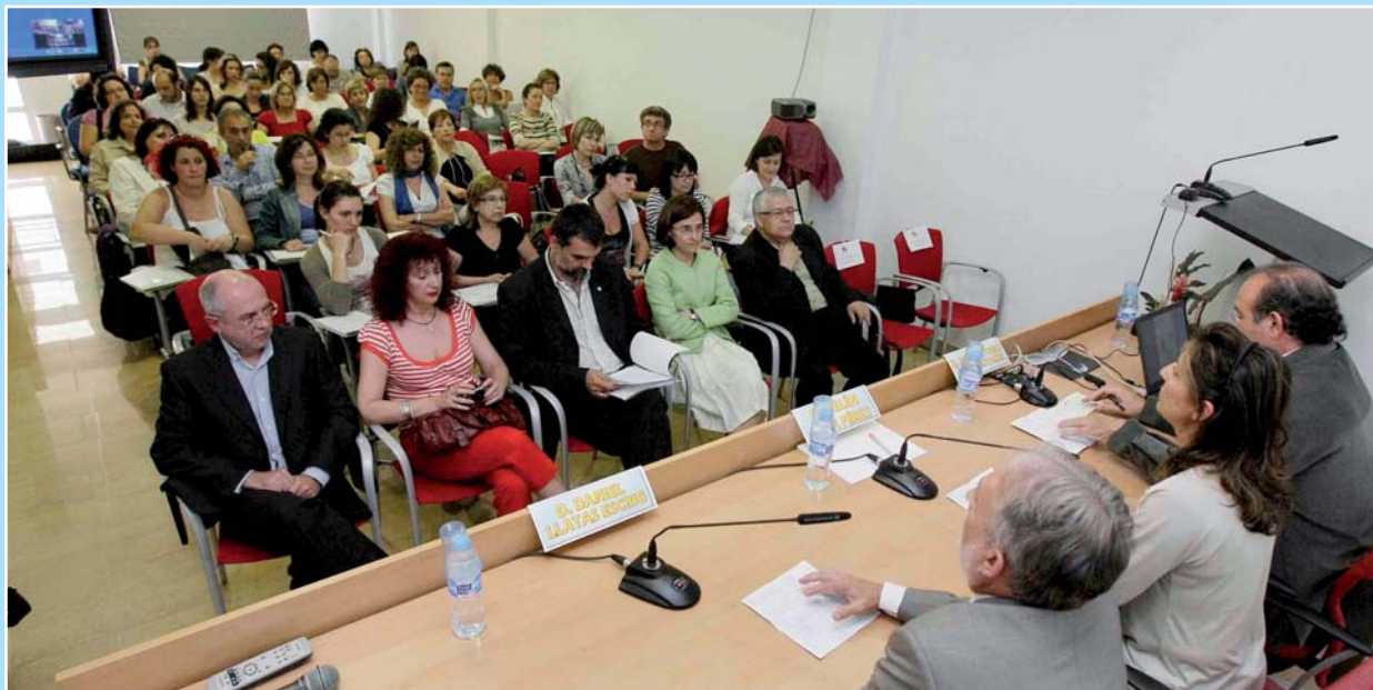
El salón de actos del Colegio se llenó para asistir a esta actividad

Esta actividad volvió a ser una referencia en este ámbito para la profesión