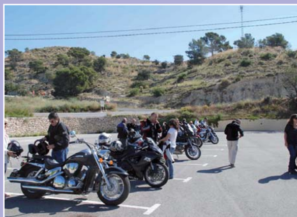
Enfermeros aficionados a las motos en una reciente salida

Los interesados en obtener más información sobre esta actividad pueden consultar la página web del Colegio www.enferalicante.org