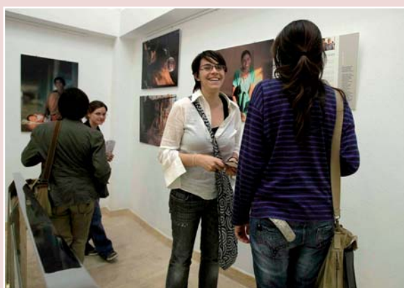
Imagen de la exposición de fotografías “Comprometidos con Anantapur” organizada en colaboración con la Fundación “Vicente Ferrer”

indio de Anantapur. En él se ha tratado de ofrecer unas condiciones de vida dignas a un colectivo que ocupa el escalafón más bajo y desfavorecido dentro de la escala de castas de la India, los dálits o intocables.