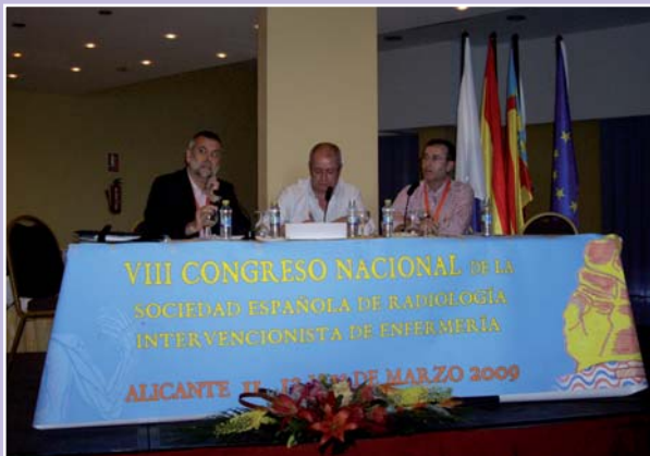
Imagen de una de las actividades desarrolladas durante el Congreso

El pasado mes de marzo tuvo lugar en Alicante la celebración del VIII Congreso Nacional de la Sociedad Española de Radiología Intervencionista de Enfermería, desarrollado bajo el lema de Avanzando en la Enfermería y al que asistieron unos 150 congresistas procedentes de diferentes unidades de Radiología Intervencionista de España.