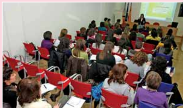
La reunión se retransmitió por el sistema de videoconferencia a Valencia y Castellón

La utilidad de este curso viene dada por la necesidad de una formación específica para acceder a las dos especialidades desarrolladas hasta el momento en nuestra profesión (la Obstétrica Ginecológica (Matrona) y la de Salud Mental) y al resto de especialidades pendientes de su puesta en marcha por el Ministerio y las Comisiones Nacionales de las mismas.