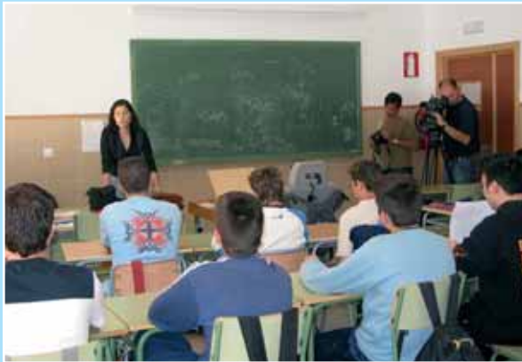
Imagen de una actividad de EpS impartida desde el Grupo ENSE

El IES "Nuestra Sra. de la Asunción" de Elche ha acogido la celebración de diversos talleres de educación afectivo-sexual, actividad que este año, debido a la falta de recursos municipales, ha sido costeada por el AMPA del centro dado que desde la misma se considera muy