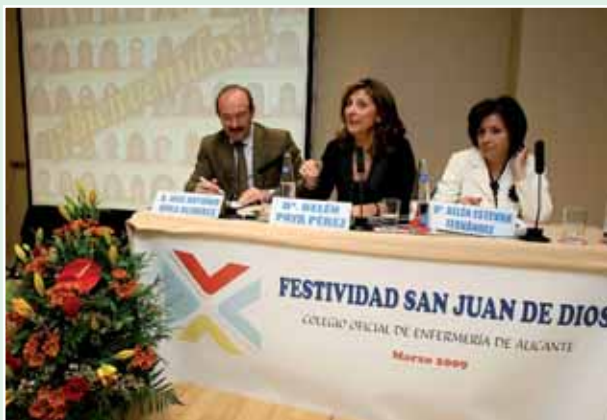
Las presidentas del Colegio y de la Asociación de Jubilados junto al presidente del CECOVA

El Colegio de Enfermería de Alicante y la Asociación Provincial de Jubilados Titulados de Enfermería de Alicante han celebrado una nueva edición de los actos conmemorativos de la festividad de San Juan de Dios, patrón de Enfermería. Con tal motivo se organizó una Semana Cultural que tuvo su momento más destacado en el acto institucional que se celebró el viernes 13 de marzo en el Hotel NH de Alicante y que acogió una serie de homenajes, reconocimientos y entrega de premios, así como el Juramento de Enfermería que de forma simbólica llevaron a cabo tanto los recién diplomados en Enfermería que se han incorporado recientemente al Colegio como todos los presentes que quisieron sumarse a esta iniciativa, siendo la primera vez que se realizaba.