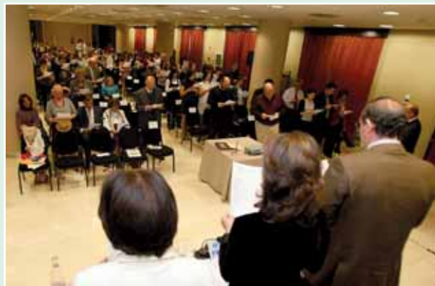
Momento en el que los asistentes realizan el Juramento de Enfermería

Dado que San Juan de Dios es también el patrón de los bomberos, se llevó a cabo un acto de hermanamiento con este colectivo con el que se comparte una inequívoca vocación de servicio a la sociedad.