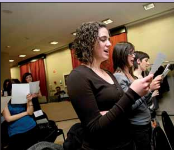
Imagen de un momento del Juramento por parte de los nuevos colegiados y de veteranos profesionales que quisieron sumarse a este momento simbólico.