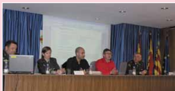
Imagen de los miembros de diferentes cuerpos y fuerzas de seguridad del Estado en la mesa redonda

Precisamente, desde el Colegio se tiene previsto organizar una jornada de salidas profesionales dirigida a recién diplomados en la que se darán a conocer todas las opciones laborales con que cuenta Enfermería en los ámbitos tradicionales y en otros menos conocidos como el Ejército y la Guardia Civil.