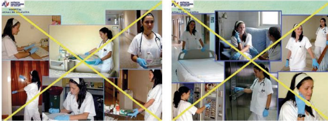
Imagen: JL Micó