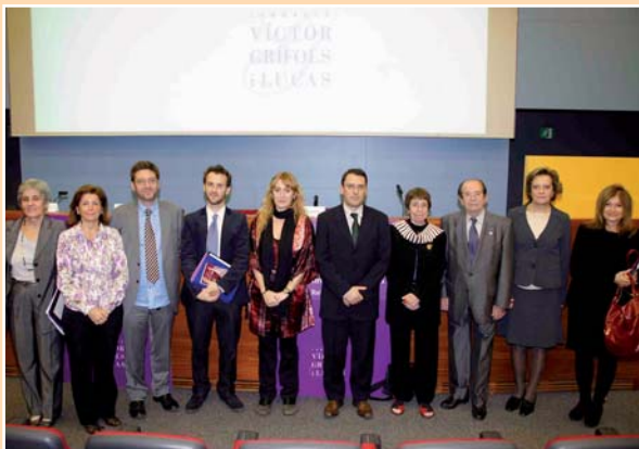
En la imagen, el acto de entrega de las becas durante las III Conferencias Josep Egozcue

El estudio ha sido becado por la Fundació Víctor Grífols i Lucas