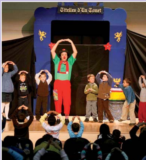
Las actuaciones son uno de los momentos más esperados por los niños