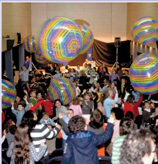
"Unidos en la alegría" volverá a ser el lema de la Fiesta de Navidad

Los interesados en asistir a la Fiesta de Navidad en Alicante deben reservar con antelación a su celebración en las oficinas colegiales (965 12 13 72 - 965 12 36 22), mientras que en el resto de localidades pueden contactar con la dirección de Enfermería correspondiente.