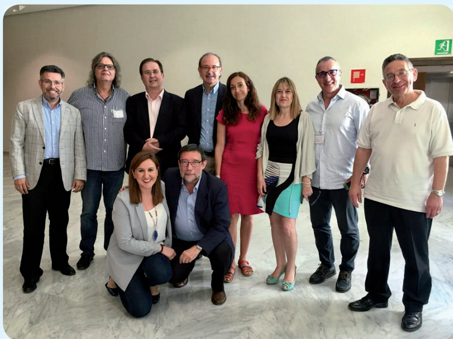
En la imagen, los portavoces de Sanidad de PP, PSOE, Ciudadanos, Compromís y Podemos junto a la presidenta de la Comisión de Sanidad, la portavoz de Sanidad del PP en las Cortes Valencianas, y los presidentes del CECO-VA y de los colegios de Enfermería de Castellón y Valencia.

PP, PSOE, Ciudadanos, Compromís y Podemos respaldan por unanimidad la iniciativa incorporando dos enmiendas a la misma