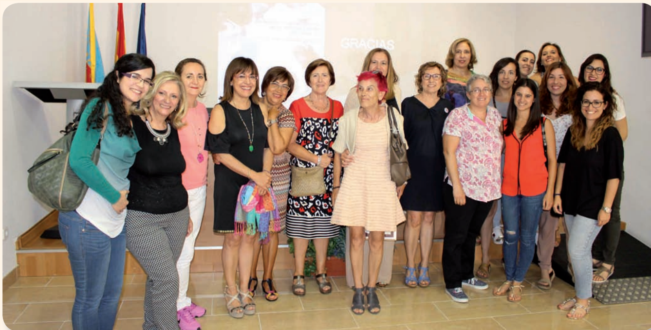
Foto de familia de las asistentes a la Jornada