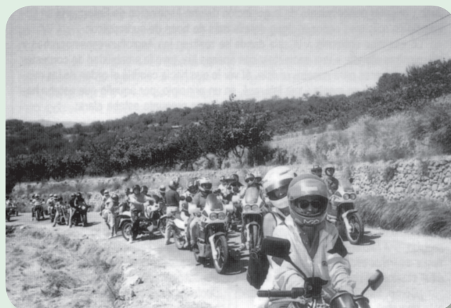
Los motoristas en un momento del recorrido en la edición de 1988