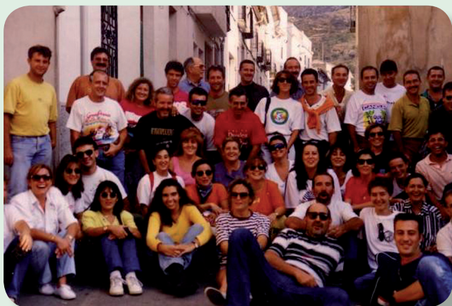
¿Te reconoces en las fotos?

Si no te reconoces o no estás, pero igualmente quieres venir, ¿a qué esperas para apuntarte?