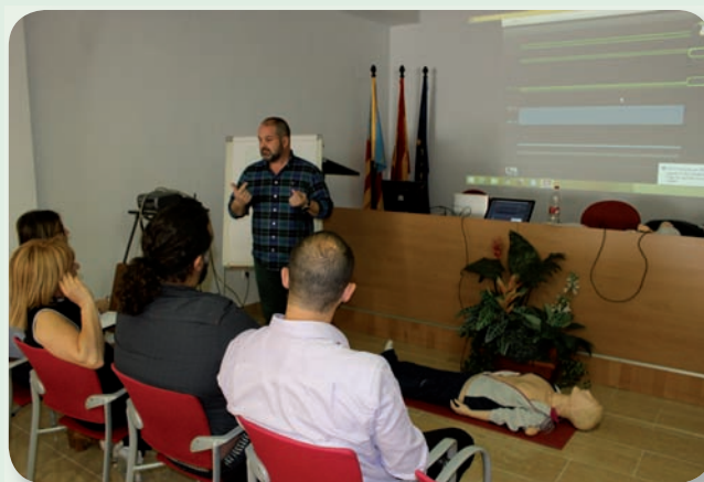
El personal del Colegio se formó en RCP