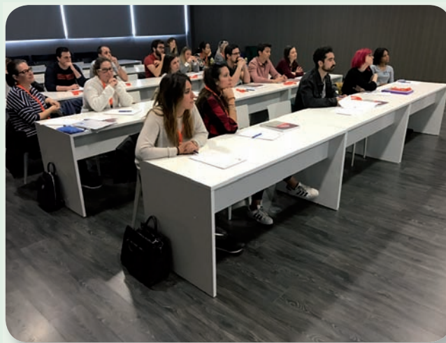
Alumnos del curso del Hospital IMED

Unas iniciativas de la Escuela de RCP del Colegio que recientemente ha cumplido un año.