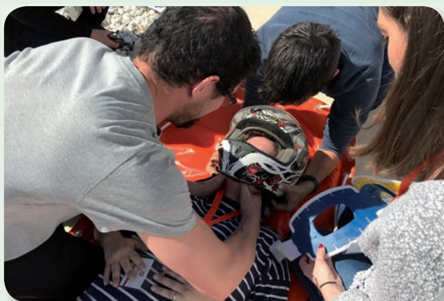
Imagen de las prácticas en el Hospital IMED