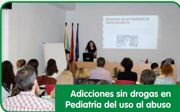
Adicciones sin drogas en Pediatría del uso al abuso