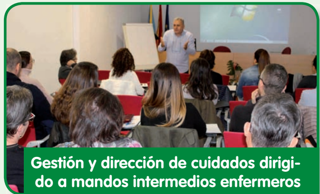
Gestión y dirección de cuidados dirigido a mandos intermedios enfermeros