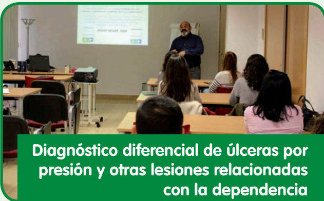
Diagnóstico diferencial de úlceras por presión y otras lesiones relacionadas con la dependencia