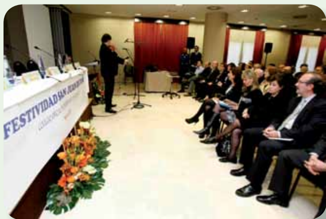
Imagen del recital del conjunto de solistas de la Orquesta Barroca Valenciana