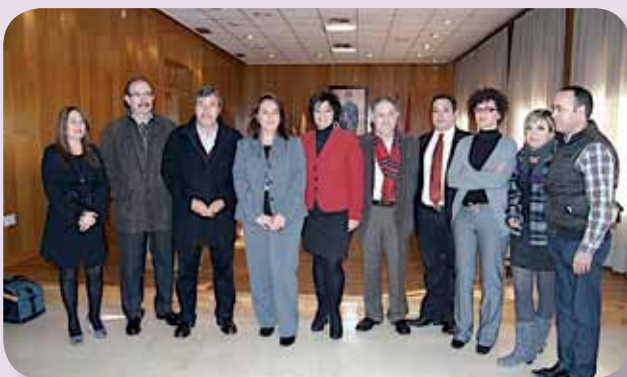
El presidente del CECOVA y representantes de los nueve ayuntamientos tras la firma del convenio

Los ayuntamientos de Aspe, Elda, Sax, Petrer, Pinoso, Mónovar, Salinas, Novelda y Monforte del Cid han suscrito un convenio con el Consejo de Enfermería de la Comunidad Valenciana (CECOVA) para llevar a cabo el desarrollo del servicio de Enfermería Escolar en el Colegio de Educación Especial Miguel de Cervantes de Elda.