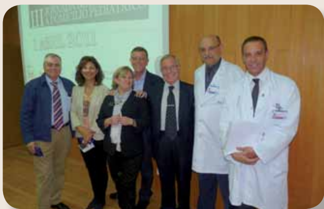
Directivos médicos y de Enfermería del Hospital y representantes colegiales de las profesiones médica y enfermera

El salón de actos del Hospital General Universitario de Alicante ha acogido la celebración de la III Jornada de Hospital a Domicilio Pediátrico, actividad organizada por la