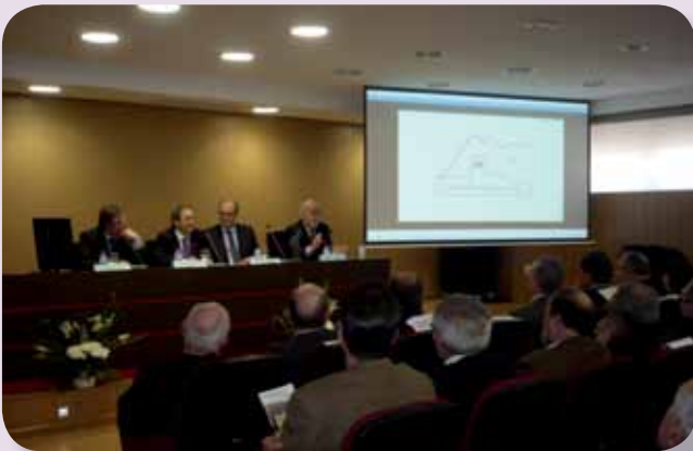
Imagen de uno de los actos en el Marina Baixa

Los hospitales Marina Baixa y Sant Joan han celebrado sus aniversarios, el vigésimo quinto en el caso del primero y el vigésimo en el del segundo. Ambos centros organizaron diferentes actos para tales ocasiones, contando con la presencia de destacadas autoridades sanitarias en los mismos.