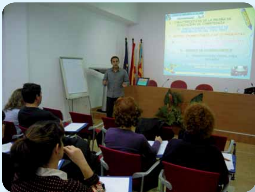
Imagen de la actividad formativa preparatoria de la prueba objetiva para el acceso al título de Enfermero Especialista en Enfermería del Trabajo

El Colegio facilita el desplazamiento y alojamiento en Madrid para su realización