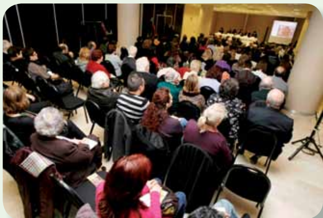
Los colegiados volvieron a dar un importante apoyo a esta celebración