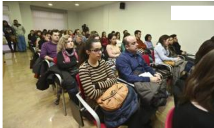
Piden otra oposición para enfermeros PILAR CORTÉS