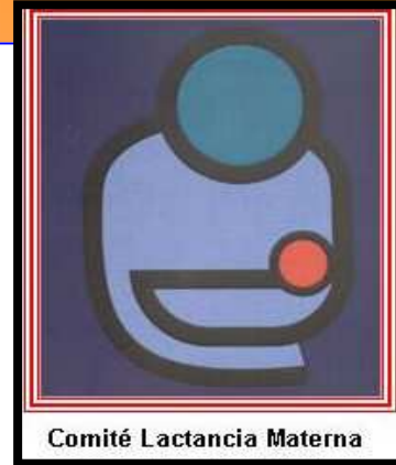
Comité Lactancia Materna