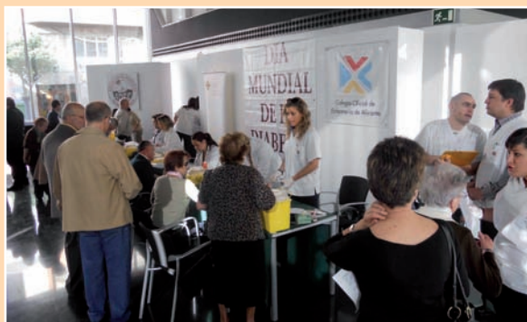
Un año más se dispusieron mesas para el cribaje de diabetes tipo 2