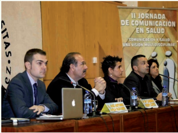
Imagen de la mesa inaugural de las jornadas