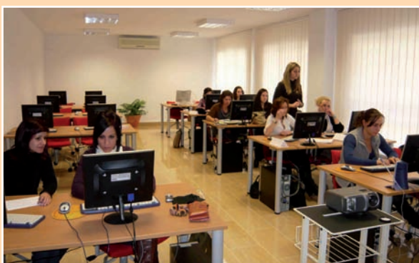
Los talleres se plantearon con el objetivo de formar a las enfermeras en la web 2.0 aplicada al ámbito de la Enfermería

El Colegio de Enfermería de Alicante ha acogido las primeras Jornadas sobre competencias digitales en Ciencias de la Salud bajo el lema El futuro de la Enfermería en la atención al paciente: enfermeras 2.0 . Esta actividad estuvo organizada por Aula Salud, especializada en la formación on-line y con