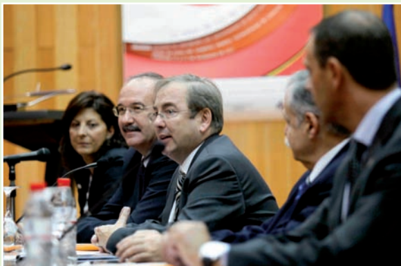
Imagen de la mesa inaugural de las Jornadas

Las Jornadas de Enfermería sobre Trabajos Científicos del Hospital General Universitario de Alicante, organizadas por la División de Enfermería del Departamento de Salud Alicante - Hospital General, han celebrado su XVI edición bajo el lema de Integración asistencial: salud, satisfacción y sostenibilidad. 20 años de UHD en Alicante.