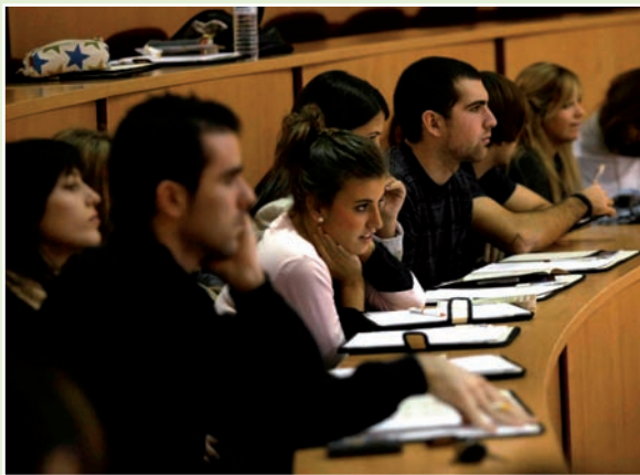
Las Jornadas contaron con una amplia asistencia de participantes

Comunicación y salud: una visión multidisciplinar fue el lema bajo el que se desarrolló en la Universidad Miguel Hernández (UMH) la II Jornada de Comunicación en Salud, una actividad organizada por la citada universidad y el Consejo de Enfermería de la Comunidad Valenciana (CECOVA), a través de su Grupo de Comunicación, con la colaboración del Colegio de Enfermería de Alicante.