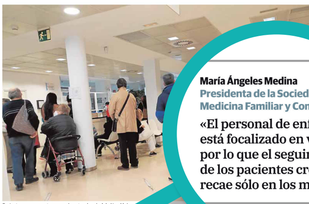
Pacientes esperan su turno en el centro de salud de Nou Molins.