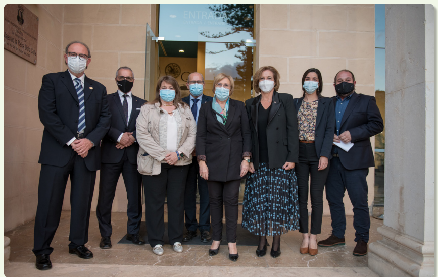
Representantes de diferentes entidades e instituciones posan antes del acto

¿Sabes que tienes un seguro de Responsabilidad Civil solo por estar colegiado?