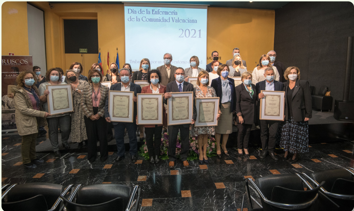
Foto de familia de quienes recogieron el reconocimiento, junto a los otros homenajeados y autoridades

La relación de departamentos de Salud, centros públicos y centros y grupos del sector privado que asistieron para recoger el reconocimiento que se realizó a las enfermeras y enfermos por su trabajo durante la pandemia fue el siguiente: