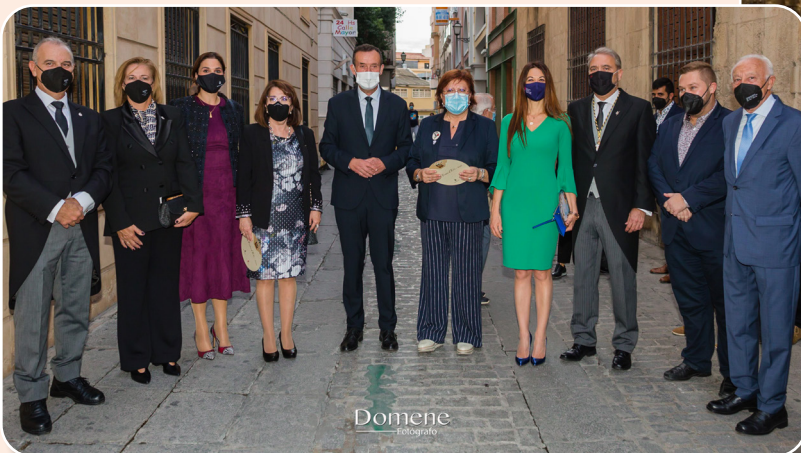
El Misteri congregó a autoridades de diferentes ámbitos