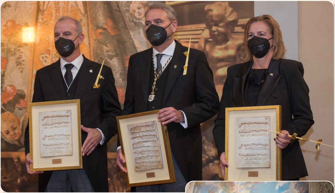
Personalidades electas y Portaestandarte recibieron el agradecimiento del Patronato

licamente al llamar a escena, aún hoy en día, a San Juan en la primera jornada y a Santo Tomás en la segunda.