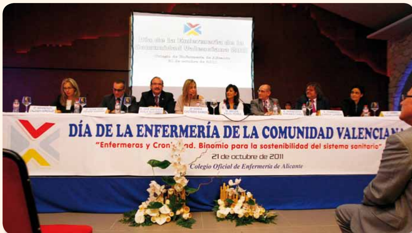
Imagen del acto de 2011

El próximo 16 de noviembre tendrá lugar la celebración de la edición de 2012 del Día de la Enfermería de la Comunidad Valenciana, acto institucional organizado por el Colegio de Enfermería de Alicante para conmemorar esta festividad instaurada por el Consejo de Enfermería de la Comunidad Valenciana. El escenario elegido para este año serán los Salones Juan XXIII de Alicante.