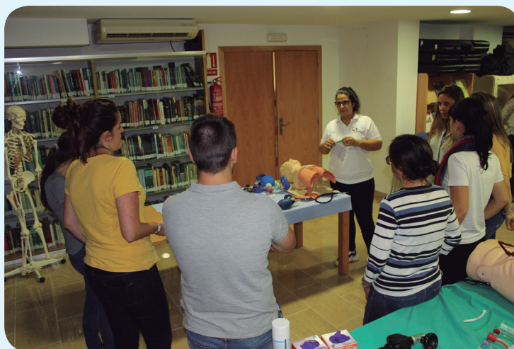
Manejo de la vía aérea y ventilación mecánica en pacientes críticos