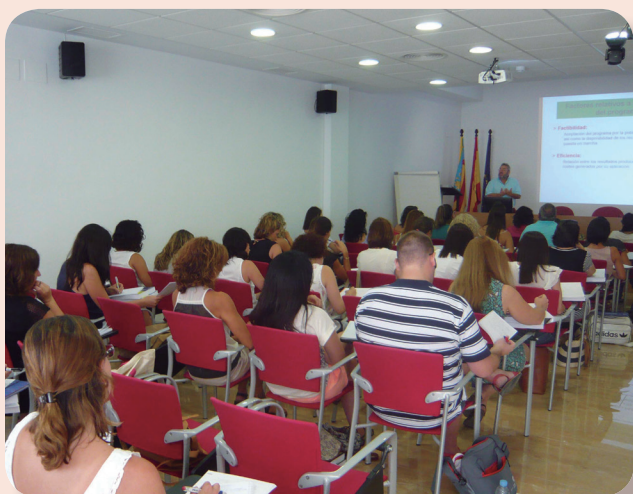
Imagen de uno de los cursos para preparar una OPE anterior

El Colegio de Enfermería de Alicante y CTO, empresa líder en formación en el ámbito sanitario, ponen a tu disposición un curso semipresencial para preparar la próxima