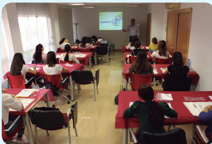
Suturas quirúrgicas y/o urgencia