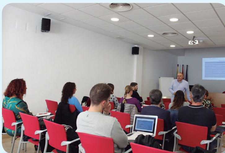
Liderazgo y dirección de cuidados dirigidos a mandos intermedios enfermeros

Os mantendremos al tanto, como de costumbre, de la programación completa de estas actividades.