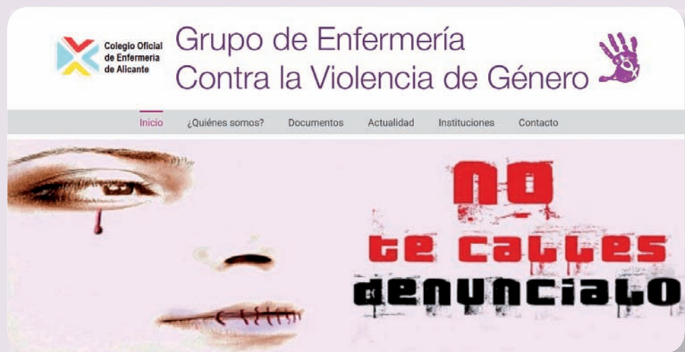
La web del Grupo de Trabajo puede visitarse en www.enfermeriaviolenciagenero.org

Desde el Grupo de Trabajo de Enfermería contra la Violencia de Género del Colegio se ofrecerán servicios de formación, asesoramiento especializado, recursos documentales, información sobre buenas prácticas e intercambio de expe-