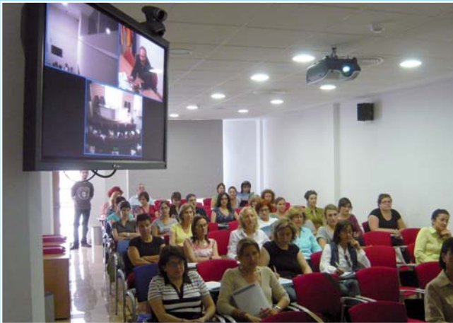
Imagen del salón de actos del Colegio de Alicante con el sistema de videoconferencia

El pasado mes de mayo tuvo lugar la celebración de la octava edición de la Reunión Enfermería y Vacunas/Curso de Actualización y Formación Continuada en Vacunaciones organizada por el Grupo de Trabajo en Vacunaciones del CECOVA