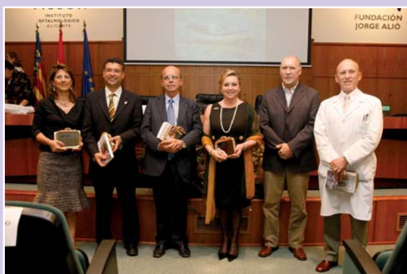
Imagen de los nuevos socios de Honor de Espejo de Alicante