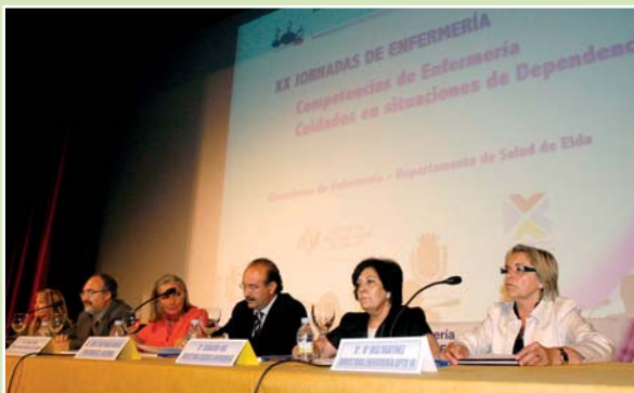
Imagen de la mesa inaugural de las jornadas

El Teatro Castelar de Elda acogió las XX Jornadas de Enfermería del Departamento de Salud de Elda, en las que se abordaron las competencias y los cuidados de Enfermería en situaciones de dependencia. Alrededor de 100 profesionales tanto de Primaria como de Especializada completaron su formación durante estos dos días.