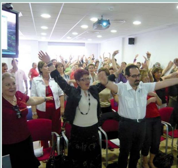
Imagen de los asistentes realizando uno de los ejercicios de relajación

Organizada por el Colegio de Enfermería de Alicante, la Asociación Provincial de Jubilados Titulados de Enfermería de Alicante y la Asociación de Fibromialgia de Alicante, el salón de actos colegial ha acogido una conferencia sobre fibromialgia dirigida a enfermeras, asociaciones de afectados, enfermos de fibromialgia y familiares.