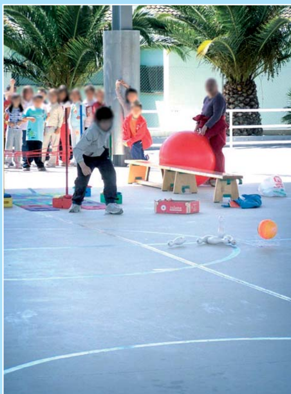
Imagen de la Jornada de Sensibilización de Villajoyosa