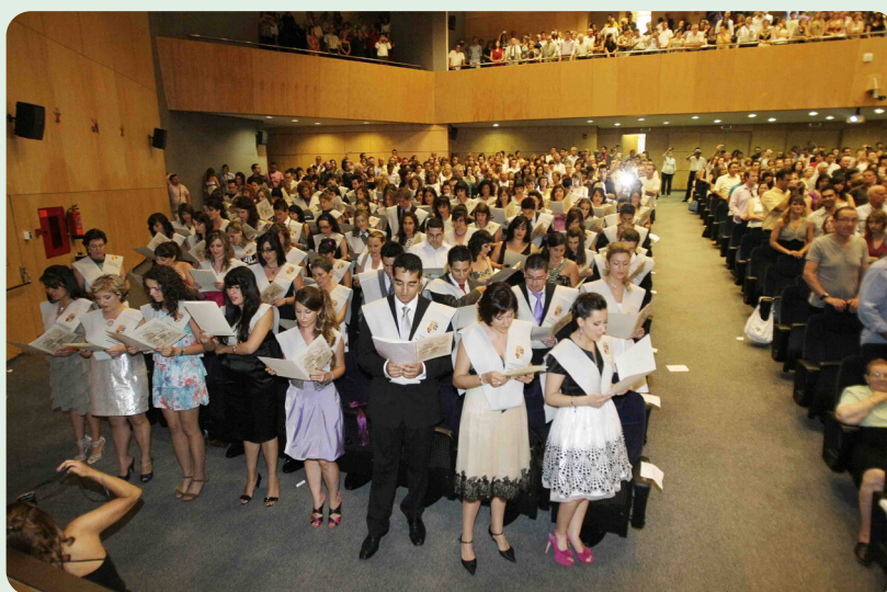
Imagen de una graduación de Enfermería en la Universidad de Alicante

En el proyecto de Real Decreto, las actuales Ciencias de la Salud se dividen en “Especialidades de la salud”, –que es donde se ha incluido a Enfermería–, y por otro lado “Medi-