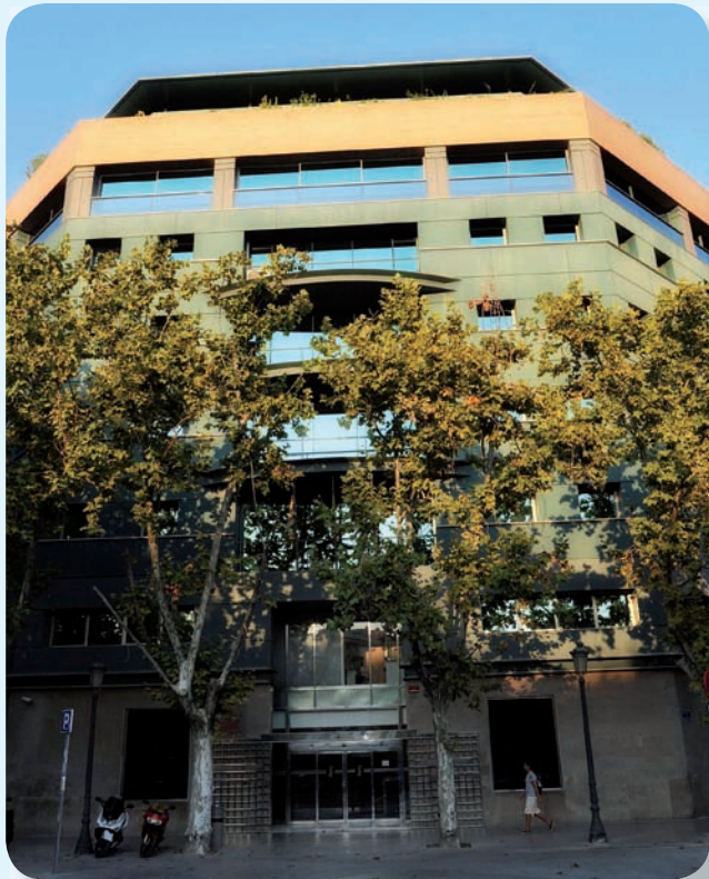
En la imagen, la Conselleria de Sanidad

Considera que los motivos del mismo fueron totalmente contrarios a la legalidad