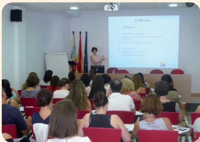
Sesión de presentación del curso en las instalaciones del Colegio

El Colegio de Enfermería de Alicante y CTO, empresa líder en formación en el ámbito sanitario, han puesto en marcha un curso semipresencial para preparar la OPE de 2016. Un curso que consta de 200 horas presenciales divididas en 80 horas hasta que se realice la convocatoria oficial de la prueba y otras 120 desde el momento de la publicación del temario definitivo, impartándose las clases presenciales en sesiones semanales de 5 horas efectivas al día en grupos de 60 alumnos.