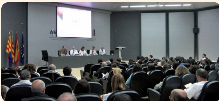
Diferentes autoridades acompañaron al autor del libro en el acto de presentación

“No hay que olvidar que personal de Enfermería atiende al paciente las 24 horas del día en el medio hospitalario y en instituciones sociosanitarias, debiendo actuar de forma rápida para prevenir complicaciones y mejorar el pronóstico de las desviaciones de salud, en ocasiones asociadas a patología cardiovascular y, por tanto, detectables con el electrocardiograma. Por todo esto y, a pesar de que la identificación de alteraciones