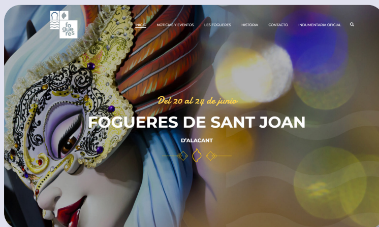
Captura de pantalla de la web de la Federació de les Fogueres de Sant Joan ( www.hogueras.es )

- Premio a la mejor portalada de barraca: banderín acreditativo a la mejor portalada sobre enfermeras/os con una