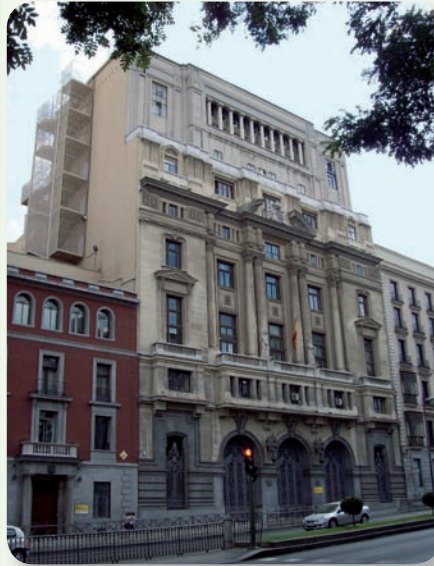
Ministerio de Educación, Cultura y Deporte

El Ministerio de Educación, Cultura y Deporte ha iniciado la tramitación de un Real Decreto que promoverá la adaptación de 142 titulaciones universitarias, de ordenaciones anteriores a la adaptación al Espacio Europeo de Educación Superior, al modelo de calificaciones de la Unión Europea (MECES), estableciendo la equivalencia entre los títulos de Diplomado y Grado. Como consecuencia de ello, ya no será necesario que los antiguos diplomados en Enfermería tengan que realizar un curso universitario de adaptación al actual Grado de Enfermería para poder tener reconocidos los mismos efectos y derechos académicos. Este