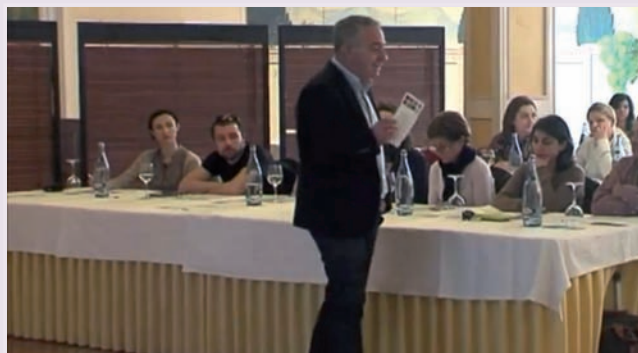
Las Jornadas combinaron sesiones teóricas y prácticas

Los inscritos en esta actividad tuvieron la posibilidad de disfrutar del fin de semana en el balneario a unos precios preferentes.