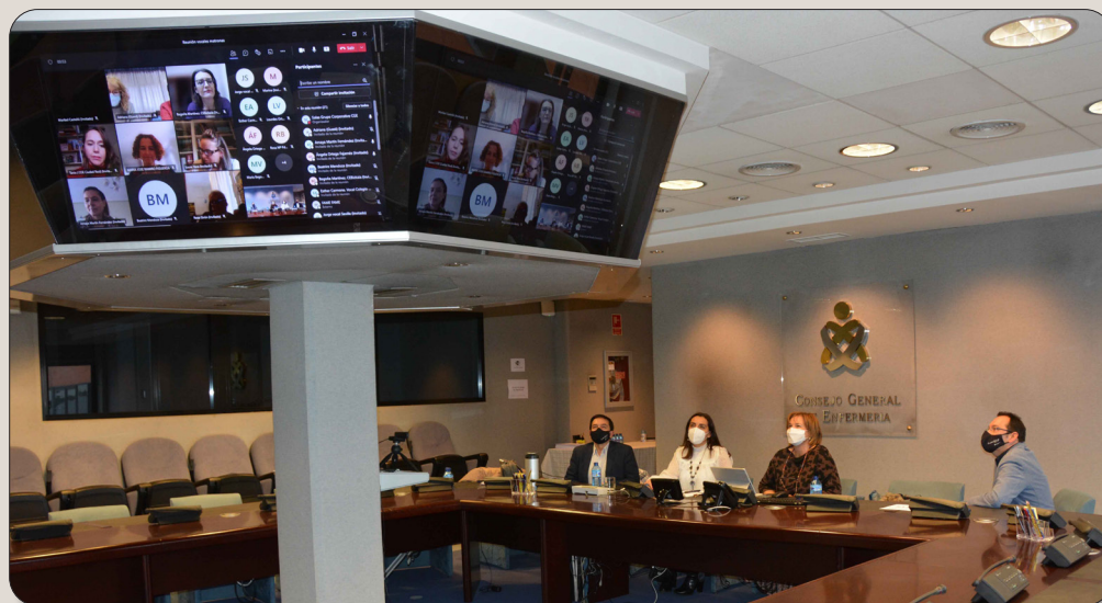
Imagen de la reunión de las vocales de la especialidad

Durante la reunión se acordó realizar un informe para enviar a los ministerios de Sanidad y de Universidades para que conozcan la situación y aumenten la cifra de plazas de